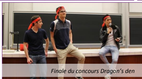
Finale du concours Dragon's den